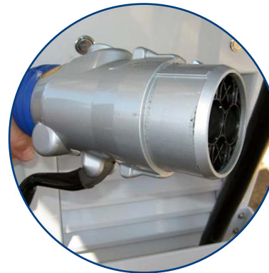
Système et infrastructure de recharge