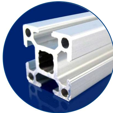
Allègement du véhicule